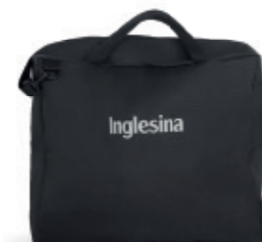
Borsa porta passeggino Stroller carry bag