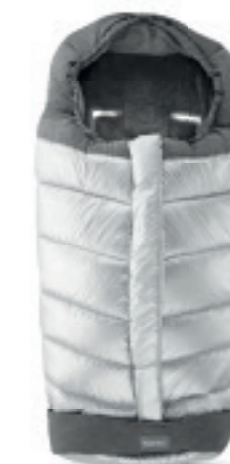
Sacco invernale Passeggino Scopri tutte le varianti a pagina 108 Stroller Winter Muff Discover the colour range on page 108