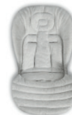
Baby Snug Pad - Cuscino Riduttore per Passeggino Baby Snug Pad - Stroller Adapter