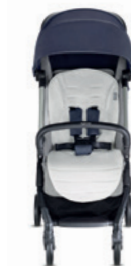
Summercover per passeggino Summercover for stroller