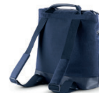
Borse Scopri i modelli e i colori a pagina 100 Bags Discover the colour range on page 100